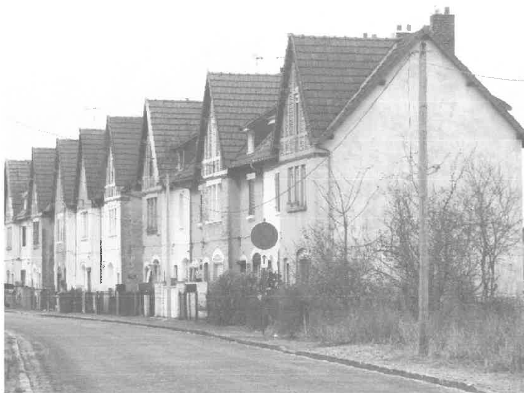
Impasse du Canal