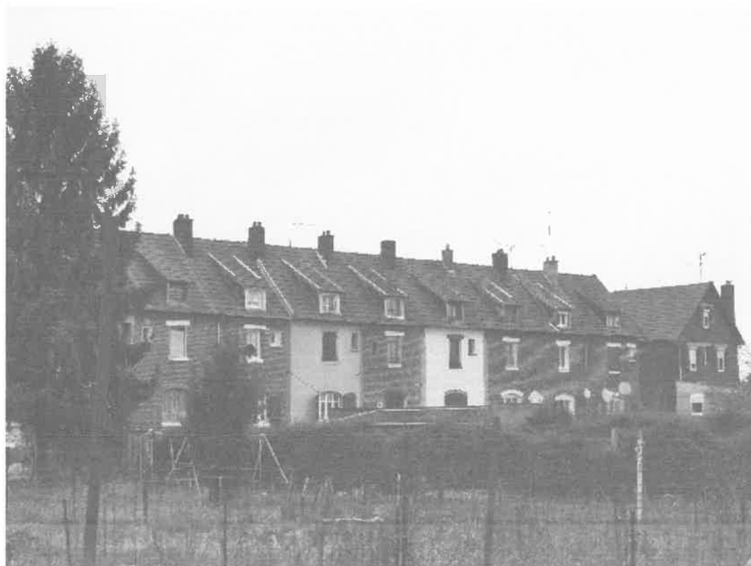
Arrière de la rue du Canal